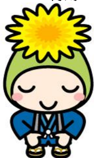
桶川市マスコットキャラクター「オケちゃん」

図書資料等の点検整理のため、下記のとおり、 坂田図書館 、 中央図書館 を休館させていただきます。 ご利用の皆様にはご不便おかけしますが、ご理解とご協力をよろしくお願いいたします。