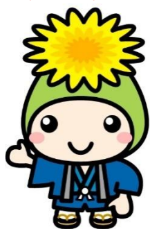
桶川市マスコットキャラクター 「オケちゃん」