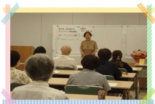
当日の講座の様子

先生の実演をはじめ、実践スキルを学ぶことができました。ご参加いただいた皆さんは、熱心に受講されていました。